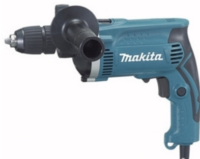
TRAPANO MAKITA HP 1631